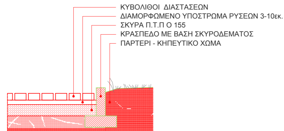
ΤΟΜΗ 1:20 ΚΥΒΟΛΙΟΙ ΕΠΙ ΔΙΑΜΟΡΦΩΜΕΝΩΝ ΡΥΣΕΩΝ