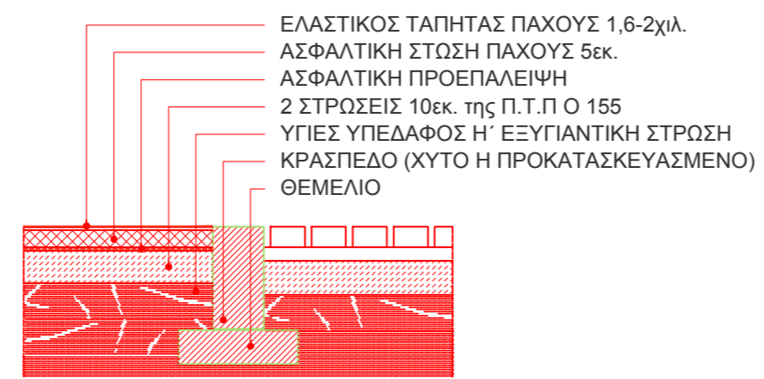
ΤΟΜΗ 1:20 ΓΗΠΕΔΟ ΣΕ ΜΗ ΑΣΦΑΛΤΩΜΕΝΗ ΕΠΙΦΑΝΕΙΑ ΣΕ ΕΠΑΦΗ ΜΕ ΔΑΠΕΔΟ ΑΠΟ ΚΥΒΟΛΙΘΟΥΣ