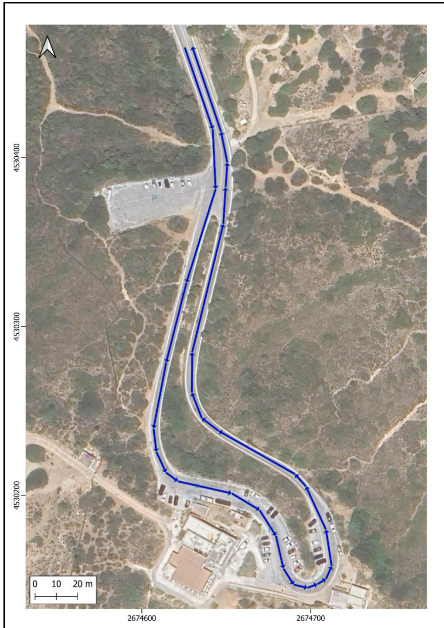
Εικόνα 2: Προτεινόμενη Κυκλοφορία Οχημάτων

Επισημαίνεται ότι με το έγγραφο με αρ. πρωτ. 615213/29.06.2022, η Περιφέρεια Αττικής ενημερώνει ότι δεν έχει αρμοδιότητα για τη συντήρηση της εν λόγω οδού και συνεπώς δεν είναι αρμόδια για να προβεί σε οποιαδήποτε παρέμβαση.